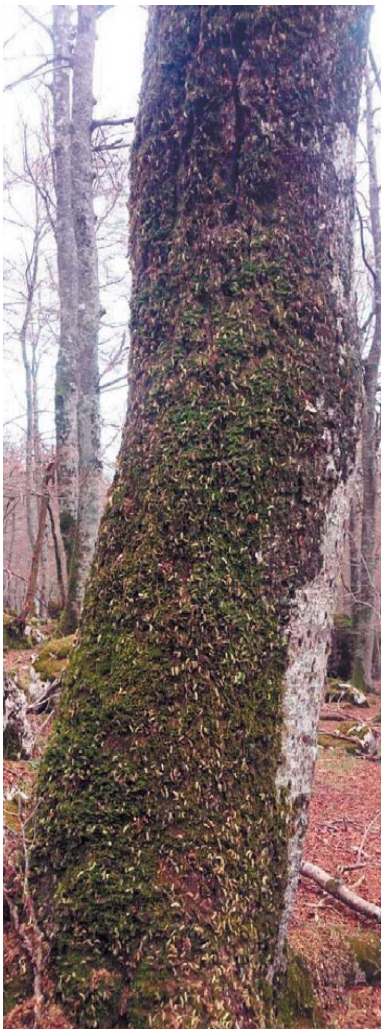
Una plaga de orugas cubre el tronco de un haya en Urbasa. Las larvas se alimentan de cortezas y hojas.

Para que eso ocurra antes habrán de procurarse el sustento energético en cortezas y hojas de haya, que tienen una consecuencia directa en lo que se conoce como defoliación del árbol. "Los daños -según el Servicio de Conservación de la Biodiversidad, de la Sección de Gestión Forestal- son limitados y menores que otros defoliadores. En la práctica adelantan la caída de la hoja".